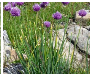
Allium schoenoprasum Hauteur : 15 cm Couleur : mauve Floraison : juin-juill