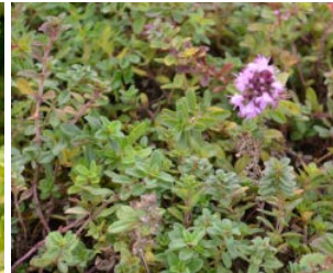
Thymus serpyllum Hauteur : 10 cm Couleur : mauve Floraison : juin-juill