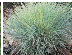
Festuca glauca Hauteur : 20 cm Graminée