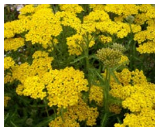
Achillea tomentosa Hauteur : 10 à 20 cm Couleur : jaune Floraison : mai-juin