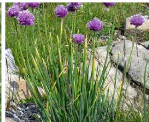
Allium schoenoprasum Hauteur : 15 cm Couleur : mauve Floraison : juin-juill