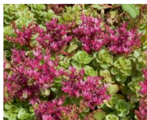
Sedum spurium Hauteur : 10 à 15 cm Couleur : pourpre Floraison : juill-août