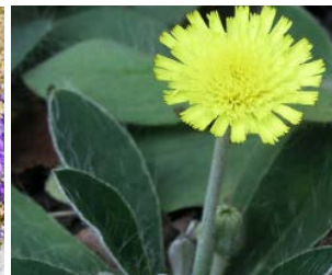
Hieracium pilosella Hauteur : 10 cm Couleur : jaune Floraison : juill