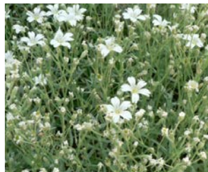
Cerastium tomentosum Hauteur : 15 à 20 cm Couleur : blanc Floraison : mai-juill