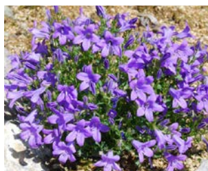
Campanula muralis Hauteur : 15 à 25 cm Couleur : violet Floraison : juin-juill