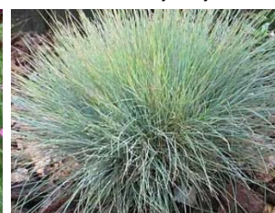
Festuca glauca Hauteur : 20 cm Graminée