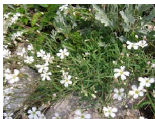
Gypsophila repens Hauteur : 20 à 30 cm Couleur : blanc Floraison : juin-août