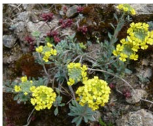
Alyssum montanum Hauteur : 10 à 25 cm Couleur : jaune Floraison : mai-juill