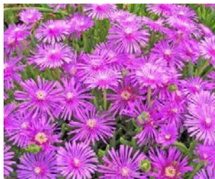
Delosperma cooperi Hauteur : 10 à 20 cm Couleur : mauve Floraison : juin-oct