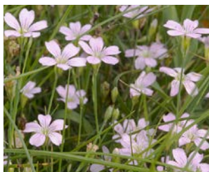
Petrorhagia saxifraga Hauteur : 10 à 20 cm Couleur : rose Floraison : mai-juin