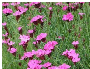
Dianthus carthusianorum Hauteur : 30 à 80 cm Couleur : mauve Floraison : juin-juill