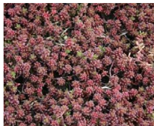
Sedum album Hauteur : 5 à 10 cm Couleur : blanc Floraison : juin-août