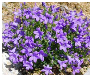
Campanula muralis Hauteur : 15 à 25 cm Couleur : violet Floraison : juin-juill