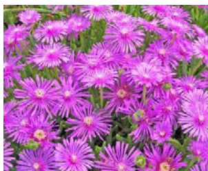
Delosperma cooperi Hauteur : 10 à 20 cm Couleur : mauve Floraison : juin-oct