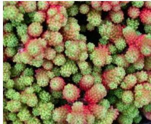
Sedum lydium Hauteur : 5 à 10 cm Couleur : blanc Floraison : juin-juill