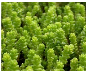
Sedum acre Hauteur : 5 à 10 cm Couleur : jaune Floraison : juin-août