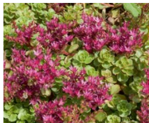
Sedum spurium Hauteur : 10 à 15 cm Couleur : pourpre Floraison : juill-août