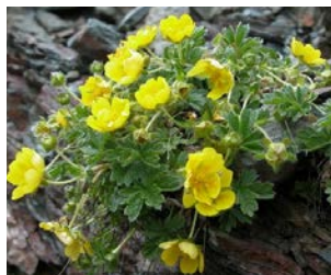
Potentilla aurea Hauteur : 10 à 20 cm Couleur : jaune Floraison : mai-août