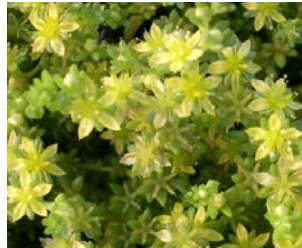
Sedum sexangulare Hauteur : 5 à 10 cm Couleur : jaune Floraison : juin-juill