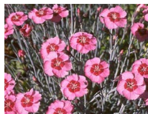
Dianthus allwoodii Hauteur : 15 à 20 cm Couleur : rose Floraison : juin-août