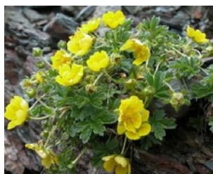
Potentilla aurea Hauteur : 10 à 20 cm Couleur : jaune Floraison : mai-août